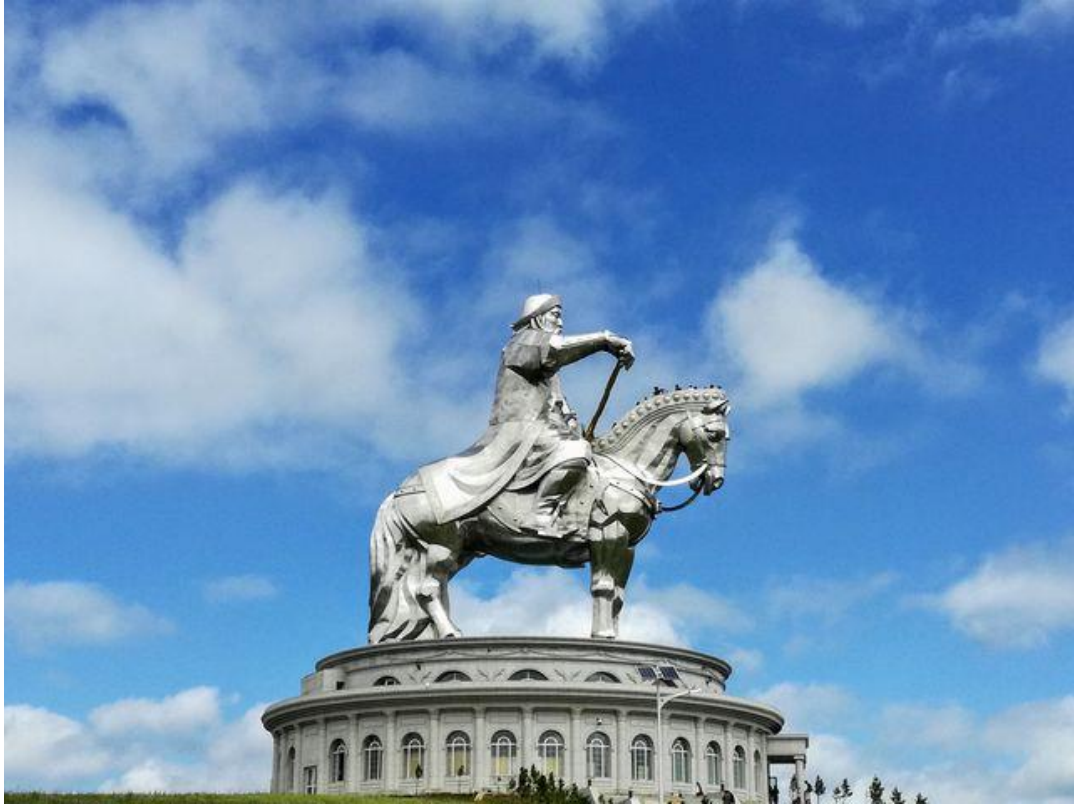
1 - פסלו של צ'נגיס ח'אן בפרק טרג במונגוליה 18

ניצחונותיו הרבים של צ'נגיס ח'אן הביאו אותו, ובהדרגה את כל מי שמסביבו, להאמין כי השמיים רוצים בניצחוננו, ויתר על כן הטילו עליו את המשימה לאחד את העולם כולו תחת שלטונו. מעבר להיותו כובש צבאי, היה גם פוליטיקאי מרשים, שעיצב מחדש את מדינתו ויצר אימפריה שהמשיכה להתפשט אחרי מותו. בשנת 1227 כינס צ'נגיס ח'אן את בניו, כוחו הלך ודעך וימיו היו ספורים. הוא השביע את בניו לכבוש את סין כולה, ובאוגוסט של אותה שנה מת. הוא מת כאשר צבאו הטיל מצור על מחוז נינגיסיא, בירתה של ממלכת סי סיא, אך דבר מותו נשמר בסוד כדי שאויביו לא ישמעו על כך. עם מותו, שלטו כשבע מאות אלף מונגולים על שטח של 35 מיליון קמ"ר ועל יותר ממאה מיליון אנשים. כעת היה עליהם להמשיך לקיים את האימפריה ועל בניו של צ'נגיס ח'אן לקיים את צוואתו.